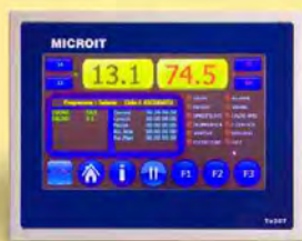
Centralina touch screen.