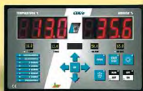
Centralina elettronica a fasi settimanali in automatico.